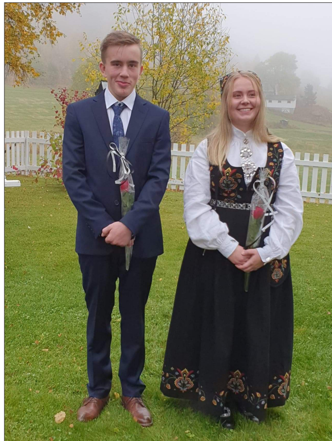
Leirskogen kyrkje 27. september.