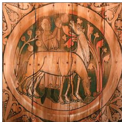
Takmåleri frå middelalderen i Dædesjø kyrka i Sverige