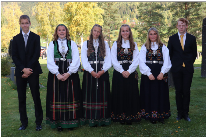
Bagn kyrkje 19. september.