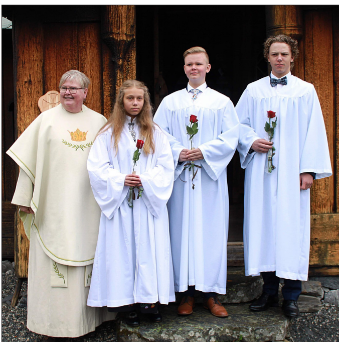
Reinli stavkyrje 27. september.