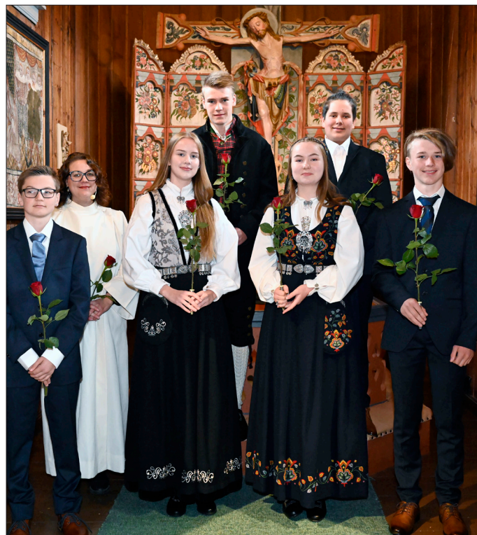
Hedalen stavkirke 26. september.