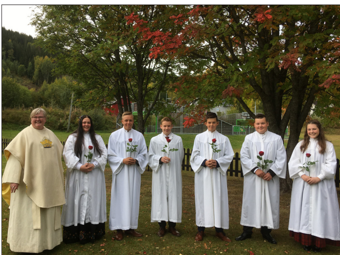
Begnadalen kirke 20. september.